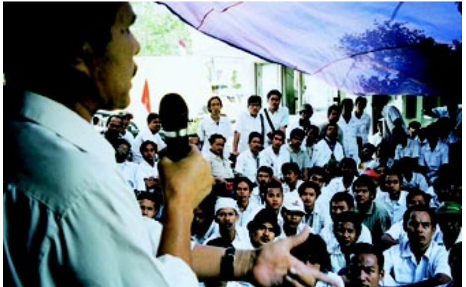
Reunión sobre la huelga en Honda Prospect

Puesto que "Metal World" circula en la prensa, la FITIM y sus afiliados conti-