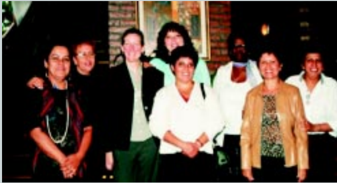
De Brasil, Chile, Colombia, Argentina y República Dominicana provenían las mujeres participantes, quienes brindaron entusiasmo y colaboración a todas las actividades del Encuentro.

En la Conferencia Regional realizada en Argentina se concluyó garantizar una mayor presencia de la mujer en las estructuras sindicales.