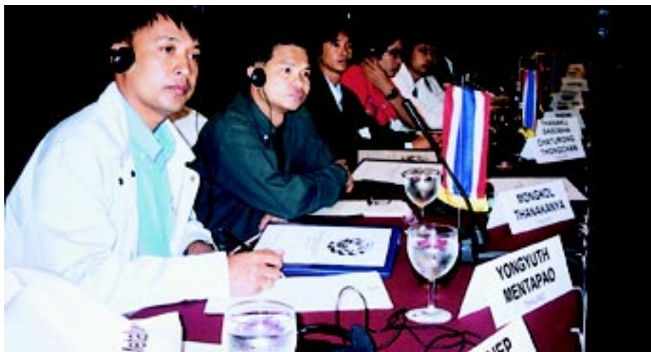
Lectura de foto: Delegados en la conferencia

Con el intercambio de información transfronterizo y el establecimiento de contactos –el objetivo de la conferencia– los delegados informaron sobre asuntos relativos a las relaciones industriales, las disputas laborales, las estrategias de organización y las ne-