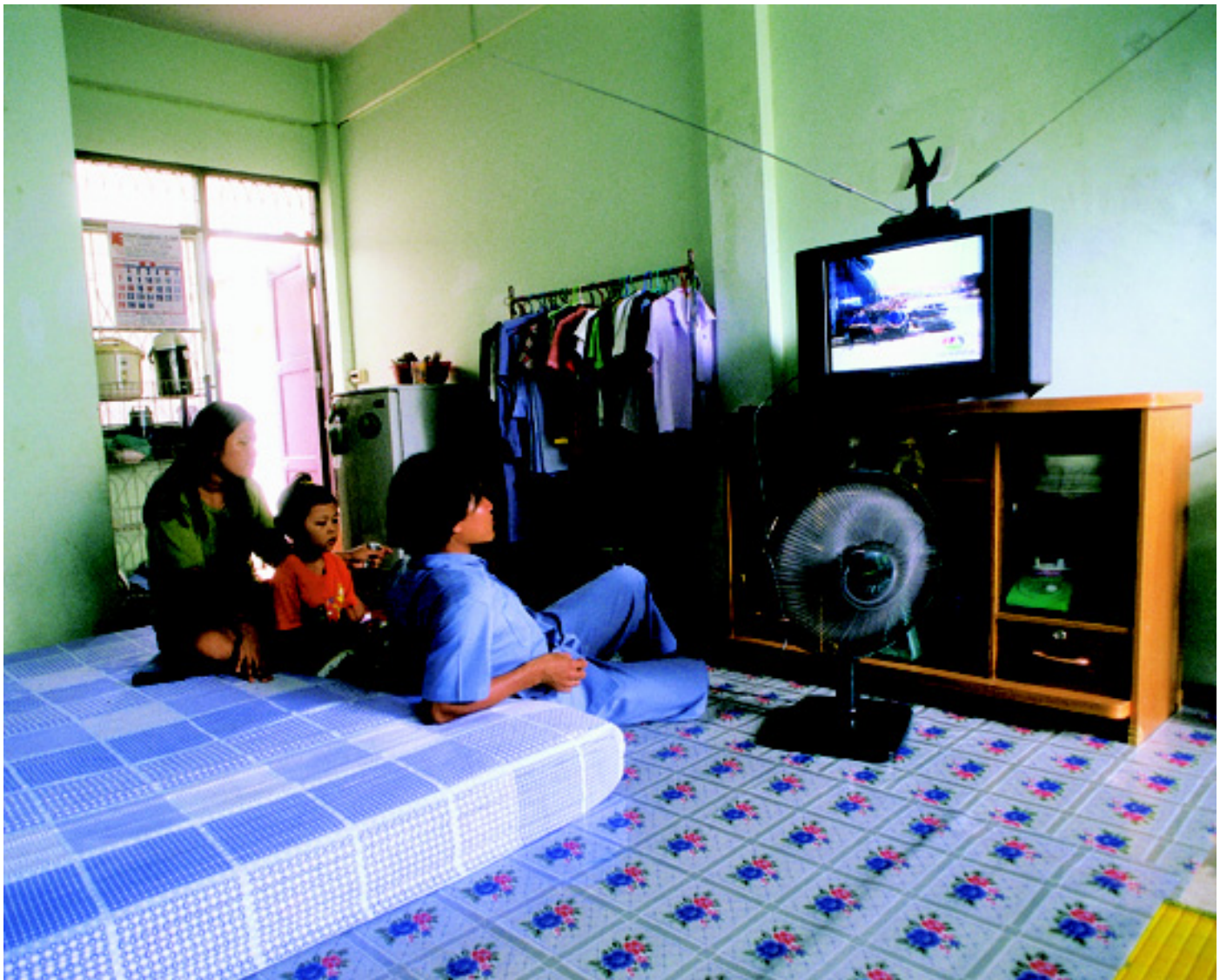
La familia comparte un departamento de una habitación de 20 metros cuadrados.