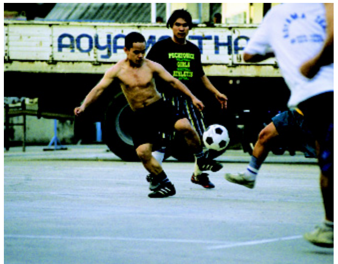
El equipo de fútbol practica en el estacionamiento de la empresa.

“Deben tener una buena educación. Haré todo lo que pueda para que así sea. Deben aprender más de lo que yo he aprendido. Quizás, si hay dinero, yo mismo pueda estudiar más cuando los niños crezcan y mi esposa pueda comenzar a trabajar. Como estamos ahora, no tengo ni el dinero, ni el tiempo ni la fortaleza.”