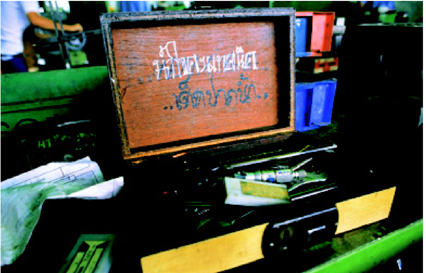
Caja de herramientas personal de Boonwat

días, incluso hasta las 10 p.m. A veces, incluso los domingos pueden ser días de trabajo, pero ocasionalmente su esposa le pide que se quede en casa con la familia.