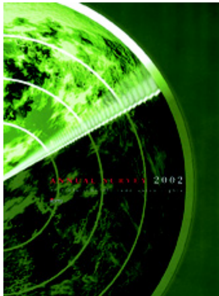
La Publicación de la CIOSL

El trabajo sindical internacional no ha hecho que el estudio de la CIOSL sea obsoleto, pero sí hace una diferencia.