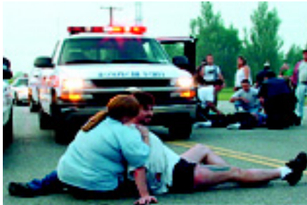
El 24 de junio, una camioneta chocó a seis huelguistas.