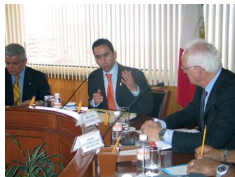
Comitiva de la FITIM junto al Ministro del Trabajo