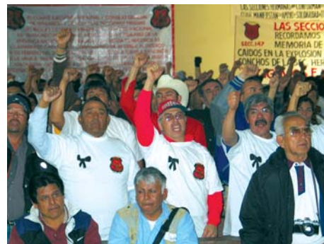
Mineros en Pasta de Conchos el 19 de Febrero de 2007

La misiva señala que se respete la autonomía sindical y se suspenda la persecución de Napoleón Gómez Urrutia, Secretario general democráticamente elegido del SNTMMSRM, quien después de la tragedia de Pasta de Conchos, fue depuesto injustamente de su cargo y sustituido por un representante nombrado por el gobierno.