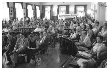
ジュイス・デ・フォラ（ブラジル）の市議会議事堂で抗議するDC労働者

たあと、1996年に創設された。この奨励金には、土地の寄贈、輸送インフラの開発、税額控除、訓練、完全装備の通信・IT・医療施設の無料利用が含まれていた。組合代表と政府代表は、工場を閉鎖するなら、連邦・州・自治体政府が負担した費用全額の返済をDCに求めることを検討している。