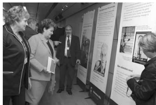
大会でのIMF展示物「死に至らしめるアスベスト」に見入る代議員たち

2005～2009年アクション・プログラムと上記の決議はIMFウェブサイト入手可能。