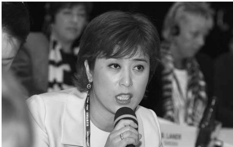
韓国KMWFのチョ・ミ・ジャ代議員