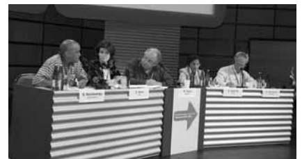
大会では3つの円卓会議が開かれた。写真は、そのうちの1つ「オフショアリングの課題に取り組む」をめぐる討議。