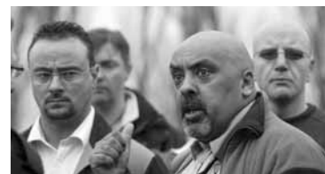
数千人の失業で動揺するMGローバーの労働者

同社から数百万ポンドが流出しているという懸念から、イギリス政府は、MGローバーとその所有者の口座を正式に調査するよう命令した。