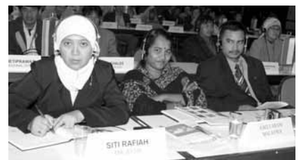
マレーシア代表団の一部