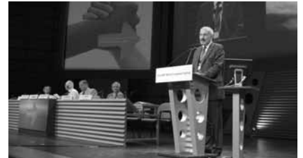
代議員を歓迎するユルゲン・ペータース IMF会長