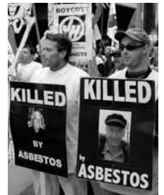
シドニーでの集会

る協約へ向けて義務を履行しており、ACTUとニューサウスウェールズ州政府は「ジェームズ・ハーディーの事業に損害を与える行動をさらに起こさずにすむことを望む」と述べた。