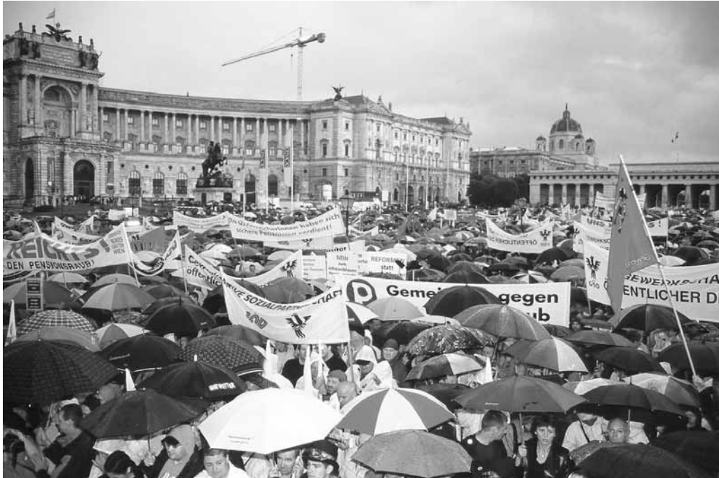
2003年5月13日：20万人を超えるオーストリア人がオーストリアの保守政権に抗議