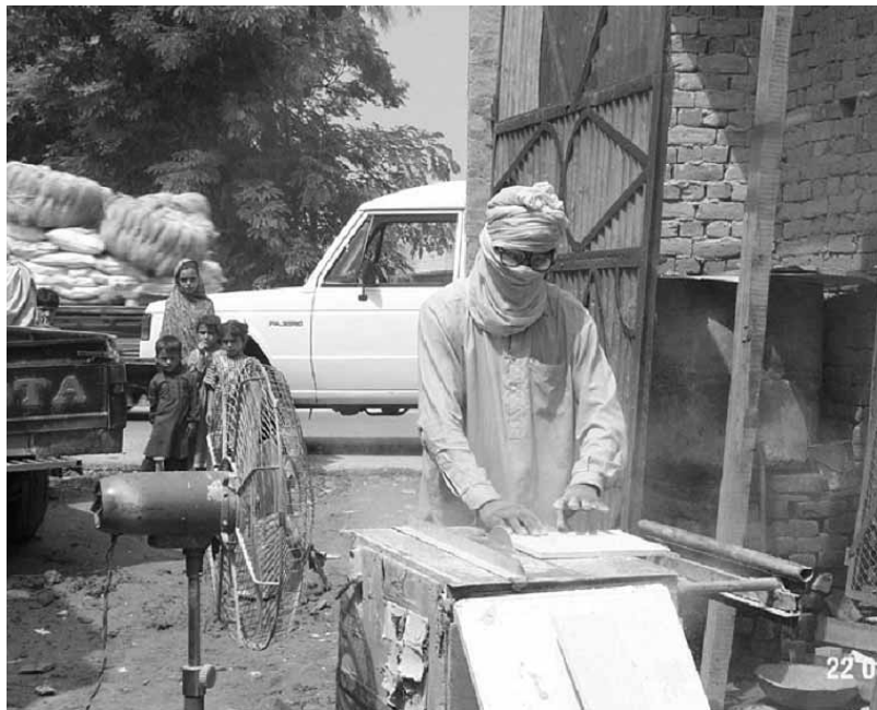
住宅地の大通りにあるマルダン市（パキスタン）のアスベスト断裁施設。そこから中にアスベスト粉塵が飛び散っている。扇風機には明確な目的がなく、回っていない。

30年かかる場合もあるため、アスベスト曝露労働者への補償を得ようと努めるのは難しい。多くの場合、立証責任は労働者にある。