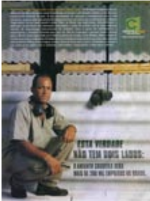
Die Medienkampagne der Asbest-industrie umfasste diese 1,3 Millionen USD teure Werbekampagne in Brasilien.

Die Asbestproduktion ist weltweit in den neunziger Jahren um die Hälfte zurückgegangen, doch gibt es Belege, daß die Produktionszahlen wieder steigen.